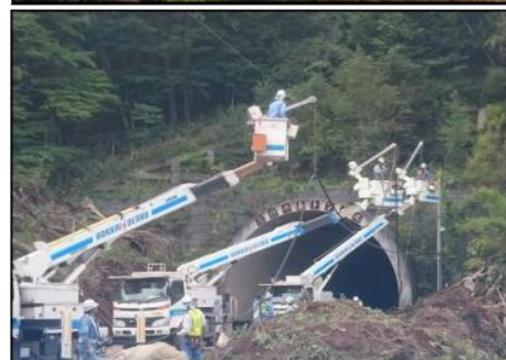
土砂崩れにより電柱が喪失。 新たに電線を張っている様子(厚真町)