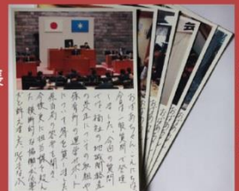
「縛りついで」 札幌の祖母に毎月手紙を書き 1枚1枚大切に保管

みどりを愛し守る会理事 柏市中央倫理法人会幹事 柏青年会議所元副理事長 柏稲門会会員 柏コネスコ協会賛助会員 柏・北海道人会会員 東葛山形県人会賛助会員 柏友誼協会后援会会長 流経大付属柏高同窓会副会長 柏市グランドゴルフ協会顧問 柏市レスリング協会会長 東宇国際交流会会員 塚崎二丁目自治会元相談役 柏市立大津二小元PTA会長